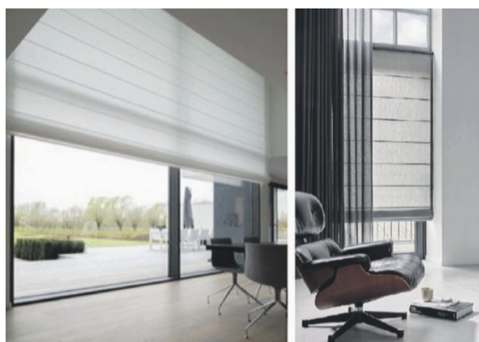
A sinistra: tende a pacchetto A destra: tende a pannello