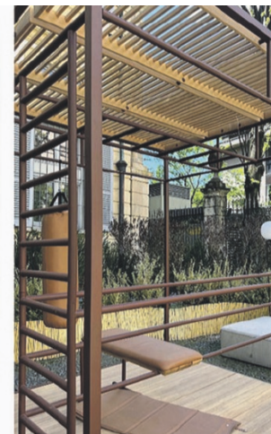
Armonia con l'ambiente esterno: il salotto outdoor e la piccola palestra in Corten, da sfondo l'ideale 'abbraccio' delle piante, relazione che crea una nuova forma di bellezza

La bellezza collaterale può manifestarsi in vari modi: