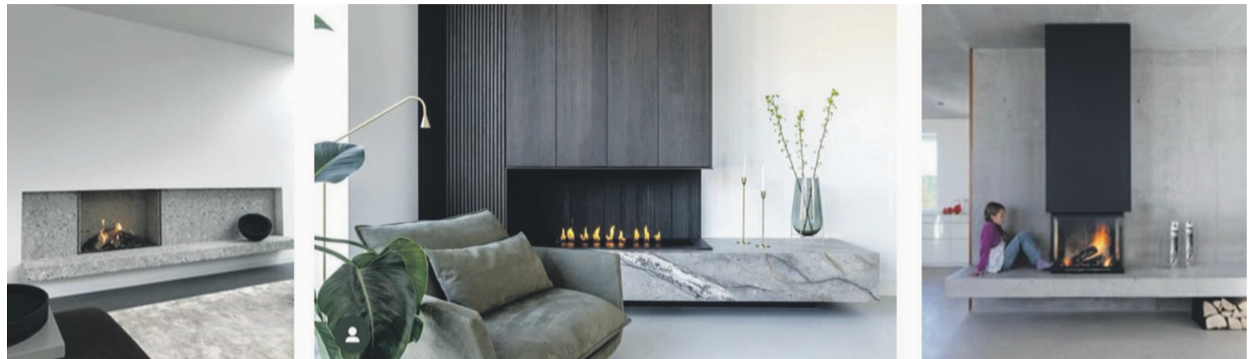
Camini per la zona living: l'assenza di simmetria e regolarità può rivelare una bellezza alternativa, creando dinamismo e un'atmosfera informale che valorizza l'ambiente

Ma c'è un tipo di bellezza non prevista, inaspettata e sorprendente, di cui occorre tener conto nella progettazione dei nostri ambienti, la bellezza collaterale, il più profondo collegamento che c'è con