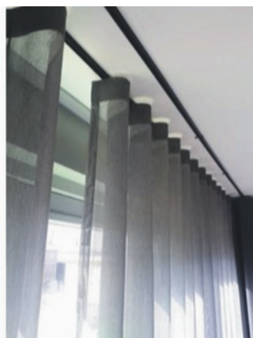
Dettagli binario doppio ad incasso e binario doppio fissato a soffitto