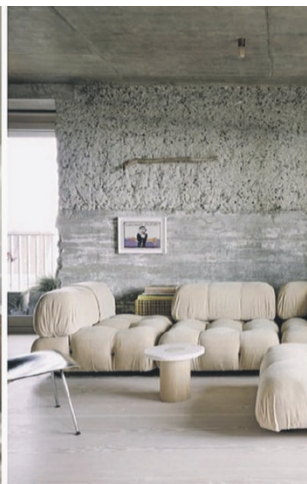
Fusione di elementi di design diversi, come vintage e moderno, può produrre un effetto visivo ricco e inaspettato, creando una nuova bellezza