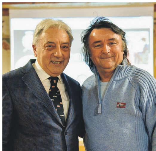
L'ex pilota di F1 René Arnoux assieme al nostro collaboratore Attilio Facconi. A destra foto ricordo del pilota francese con i ragazzi della Scuola di Karting Tazio Nuvolari Italia presso il Kartodromo di Bagnolo San Vito

Ritenuto come uno dei più veloci di tutto il Circus, secondo molti non riuscì mai ad esprimere appieno il suo potenziale, ma è ricordato come una delle figure più celebri della Formula 1.