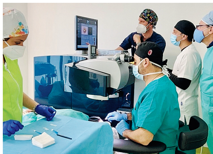
Un intervento laser

«Il Centro Oculistico Mantovano nasce da un'idea che ho sviluppato nel tempo, dopo circa una ventina d'anni di chirurgia. Desideravo avere una mia creatura che rispondesse alle esigenze di lavoro e mi permettesse di