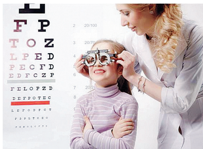
I problemi alla vista non vanno mai sottovalutati

«Gli ortottisti – aggiunge Fiore – si occupano sia di prevenzione di primo livello, promuovendo un'informazio-